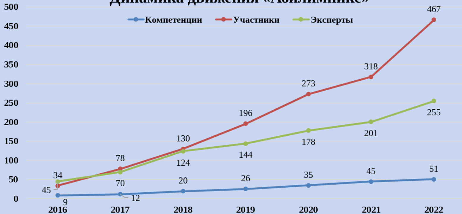
Динамика движения «Абилимпикс»

Региональный центр развития движения «Абилимпикс» Свердловская область